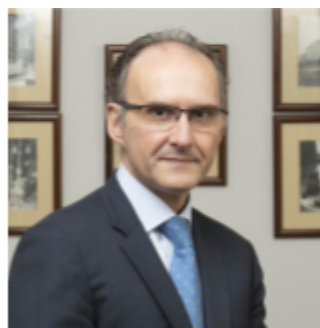
CEO Spain & Latam